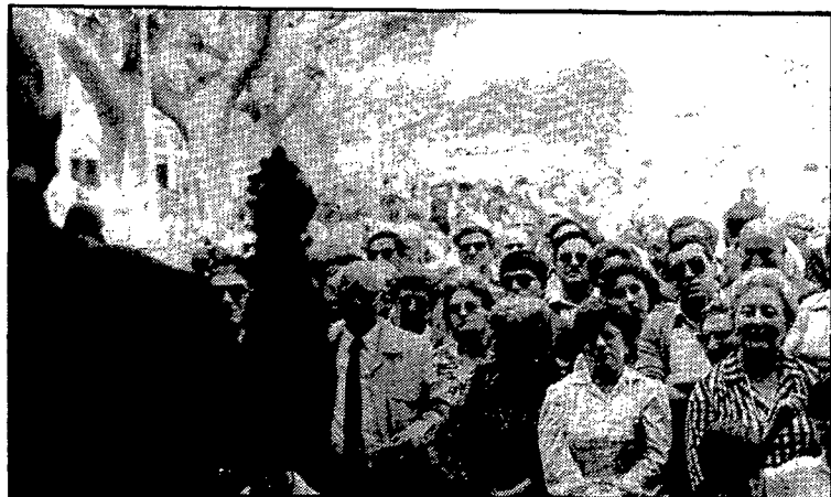
Els actes de germanor entre els actuals habitants de Portbou i gent que hi ha viscut al llarg de la seva vida foren molt concorreguts

SANTA LLOGAIA D'ÀLGUEMA. — S'ha procedit ja al lliurament definitiu de l'obra d'abast d'aigua i sanejament al barri de Raval de Cases Noves, de l'Ajuntament de Santa Llogaia d'Àlguema. L'obra estava inclosa dins el pla d'Obres i Serveis de la Generalitat de l'any 1982 i consisteix en dotar d'una xarxa adequada d'aigua potable i de sanejament els carrers del nucli del Raval de Cases Noves, situat a 300 metres del nucli principal del municipi de Santa Llogaia d'Àlguema. El pressupost ha pujat a un total de 580.000 pessetes, a les quals l'Ajuntament n'ha aportat 290.000; la resta correspon a la subvenció del Pla d'Obres i Serveis.