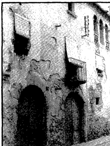
Un edifici del carrer dels Polls. (Foto: L.R.).

Tots els edificis que componen el teixit històric tindran una subvenció de la direcció general de l'Habitatge, d'un 20% del total del valor de les obres, sense que en cap cas no pugui excedir les 225.000 ptes. per a cada habitatge de què es compongui l'immoble. Excepcionalment, i tenint en compte les circumstàn-