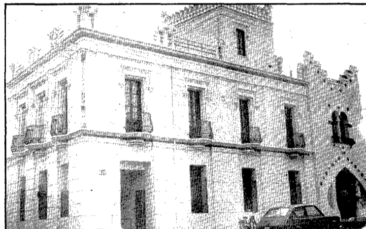
Caldes de Malavella és rica en edificacions com aquesta, que segons el pla general han de ser protegides especialment.

cies socio-econòmiques del sol·licitant, la subvenció podrà arribar fins al 50% del valor de l'obra, sense que en cap cas no es pugui superar la quantitat abans esmentada.