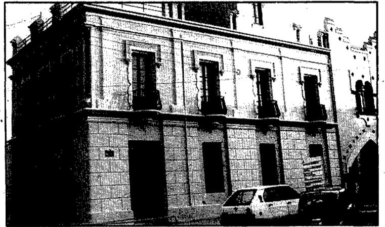
La Casa Rosa, un exemple de restauració d'un edifici de principis de segle sota la iniciativa del govern local.

Ara cal que l'ajuntament i la gent de Caldes vetlli per conservar tots aquests testimonis d'una Caldes passada que els anys han respectat. Es una feina difícil, si comptem totes les petites coses que guarden un esgrafiats descolorit, una finestra amb flors esculpides o una porta aràbitzant.