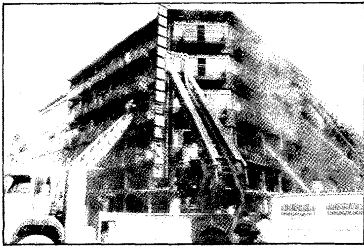
42 MORTS EN UN INCENDI A ISTANBUL. — Quaranta-dues persones van perdre la vida en l'incendi que ahir al matí va declarar-se en un hotel del centre d'Istanbul. Segons van informar les autoritats la majoria de les persones van morir quan, tractant d'escapar del foc, es van llançar al buit des de les finestres superiors de l'edifici que tenia vuit plantes.