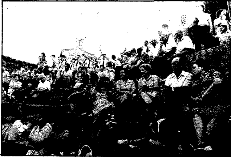
Asseguts mirant les sardanes a la plaça