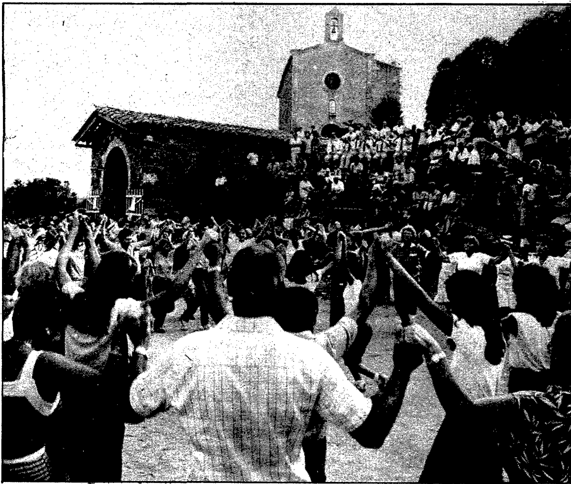
Una bonica perspectiva del que era la festa petita de Caldes

BLANES. (Del nostre corresponçal).— El Centre Excursionista de Blanes té previst pel proper cap de setmana, dies 23 i 3 d'octubre, una sortida al pic de la Muga (de 2.860 m.), a la comarca de la Cerdanya, en el límit de l'Alt Urgell. L'excursió, que es realitza en aquesta època que encara no hi ha neu pel camí, és molt apropiada per a la majoria d'excursionistes. S'anirà en cotxe fins a Prullans, prop de Martinet, des d'on se seguirà un camí forestal per la vall de la Llosa i, s'acamparà a Prat Xiuixirà. L'endemà es seguirà camí pels llacs de Vall Civera i fins al pic de la Muga. La tornada serà pel mateix lloc.