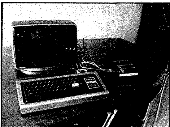
El microprocessador

Està prevista pel curs de l'any vinent l'ampliació a segon grau de les especialitats que ja es donen a primer. Enguany ja s'han presentat per matricular-se prop de 600 alumnes.