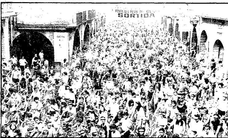
L'any passat la concentració a la plaça del Vi ofería aquest magnífic aspecte. Enguany es vol millorar. (Foto Codolà).

Pel que fa als horaris de la Festa del Pedal de diumenge són semblants als de l'any passat. De vuit a nou s'efectuarà la concentració dels participants a la