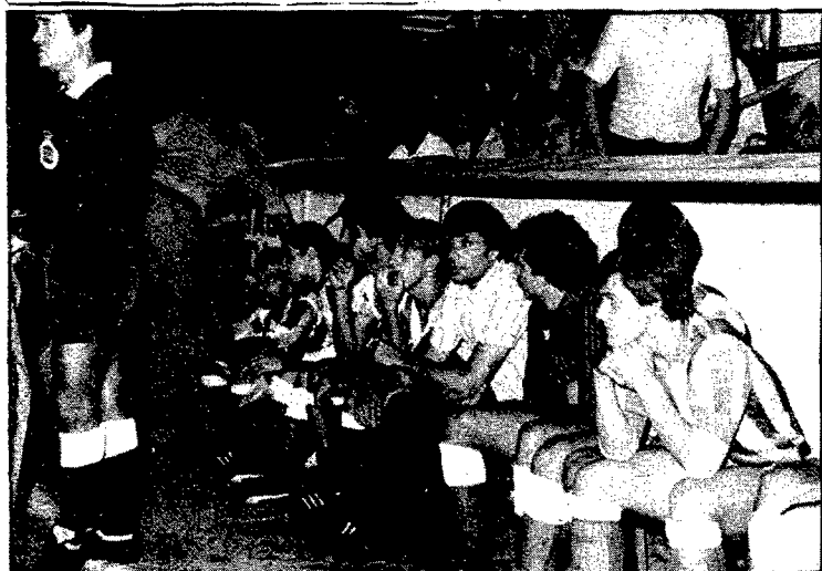
Després dels darrers resultats, al Figueres potser li convenia una mica de descans a les competicions