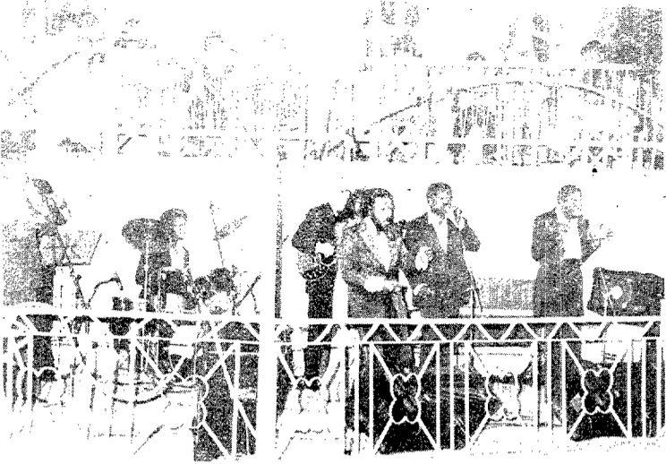
"The Platters" van interpretar els seus temes de sempre