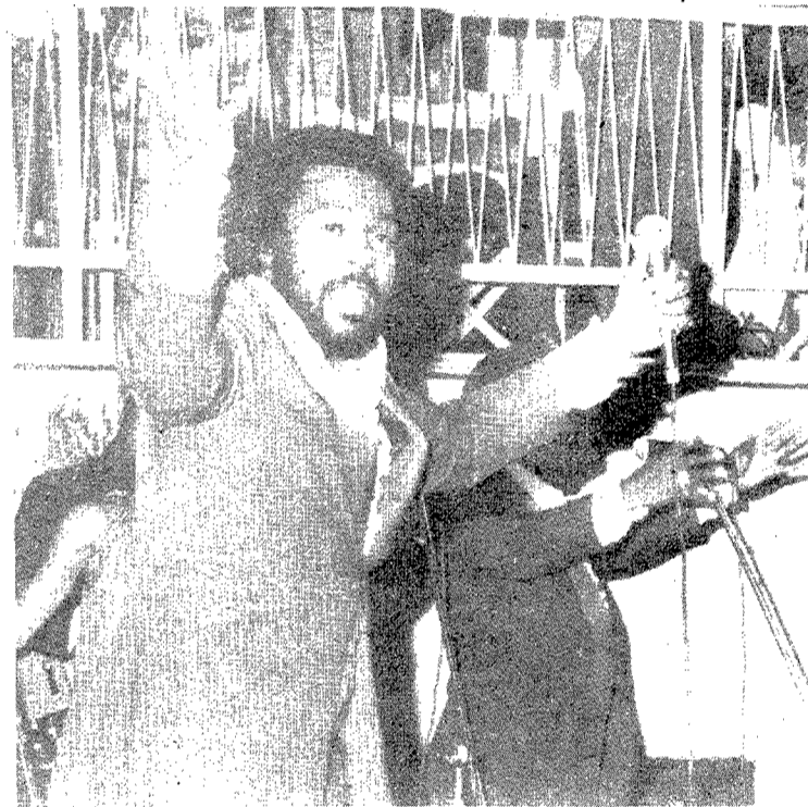
Tots els components del grup són nous

Al finalt, tot i la decepció d'alguns, el públic va sortir satisfet. No havien sentit cantar els Platters autèntics, però si més no, els havien recordat, cançó rera cançó: "només tu".