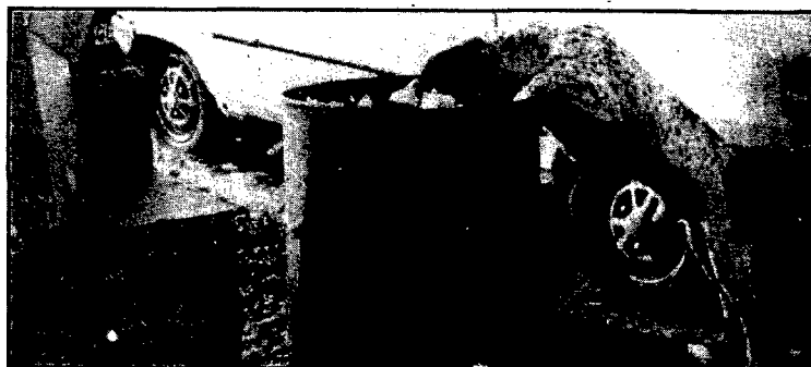
La cassusa del dàlmata de raça

FOTO RIERA c/. Dr. Robert, 9 Tel. 64 09 03