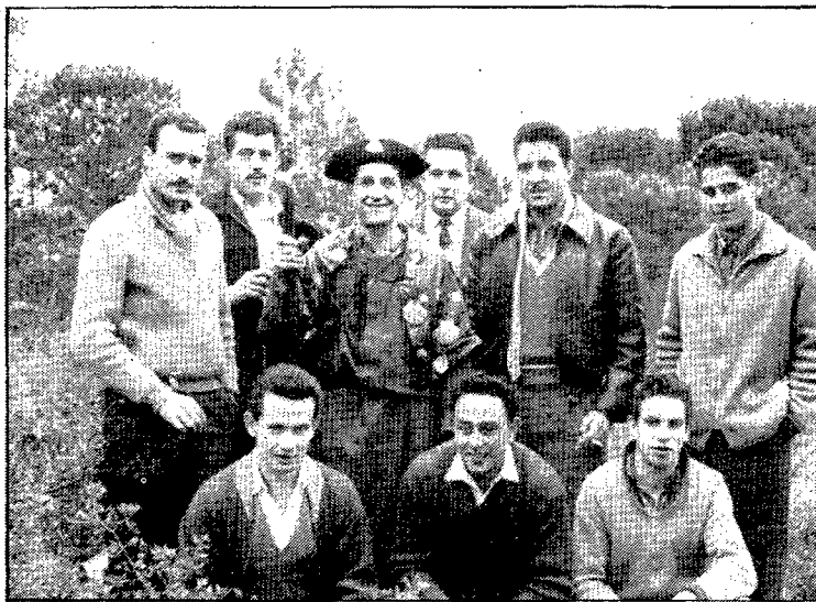
Any 1955. El pelegrí, satisfet de la missió que se li encomanava

Enmig de camps i de boscuries de fred, de vent i de perills acomplim el vot fa cinc centúries i l'acompliran els nostres fills