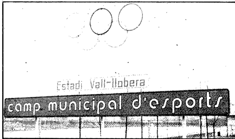
L'estadi del Caldes servirà per a la posta a punt de la Reial Societat