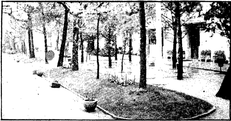
L'interior del balneari Prats de Caldes de Malavella