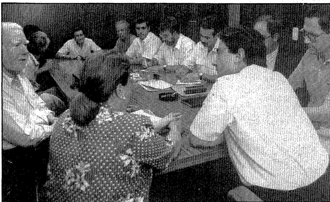
A la imatge, una de les reunions que van mantenir el mes d'agost passat els representants del grup Asland i el comitè d'empresa de Pavicsa.