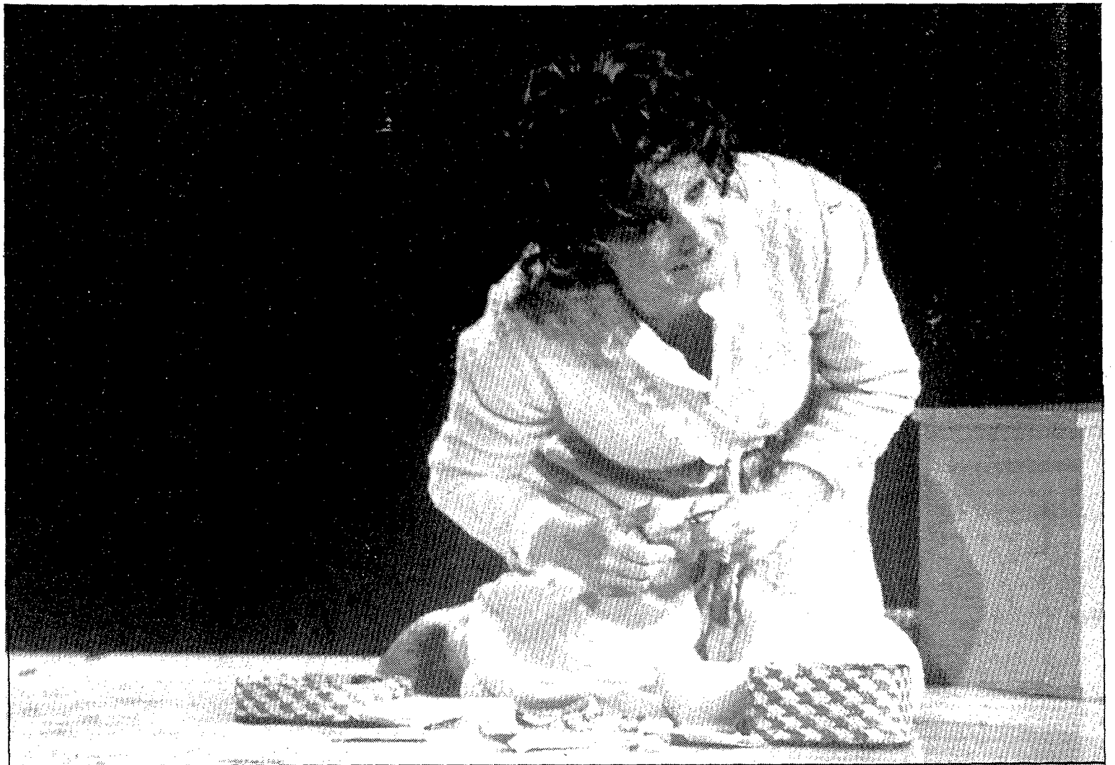
DDT és un dels cinc grups participants a la mostra i l'encarregat de posar punt i final a aquesta.