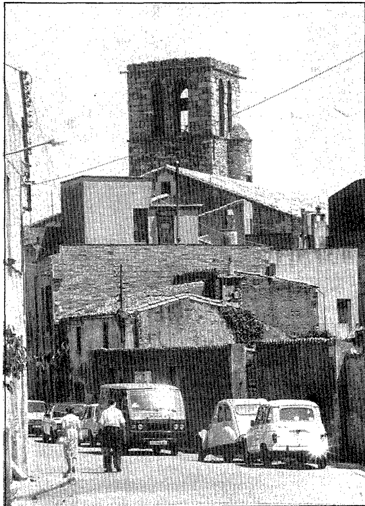
Els carrers de Caldes de Malavella gaudiran dels actes programats per cinc dies.

La Salseta del Poble Sec és un dels conjunts que cada any arriba a Caldes per la festa, «esperem que aquest any tindrà una acollida especial a causa de la forta embranzida i acollida que està agafant la música de salsa. Tot i que el rock continua agradant, la salsa és un gènere que està agafant molta