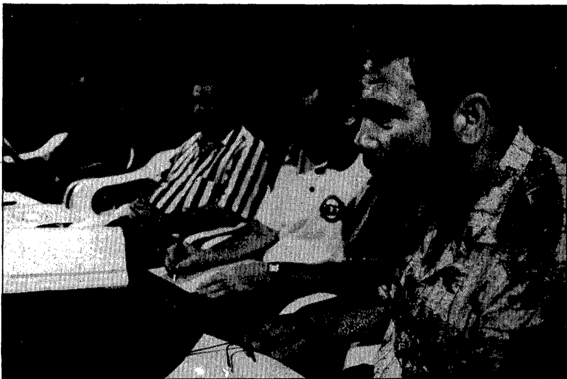
El dèficit del Lloret va superar els 23 milions de pessetes.

Una nota del sponsor, l'hotel Don Juan, presentada al club un dia abans de l'assemblea, va ser durament criticada pels socis en el decurs de la reunió quan se'ls va fer saber que aquesta firma reclamava 1.153.317 pessetes en concepte de menjars, roba esportiva, factures de gestoria pel tema del bingo i despeses diverses. Els socis no van acceptar aquesta factura que l'hotel Don Juan es va treure de la màniga, i van rebutjar-la amb 51