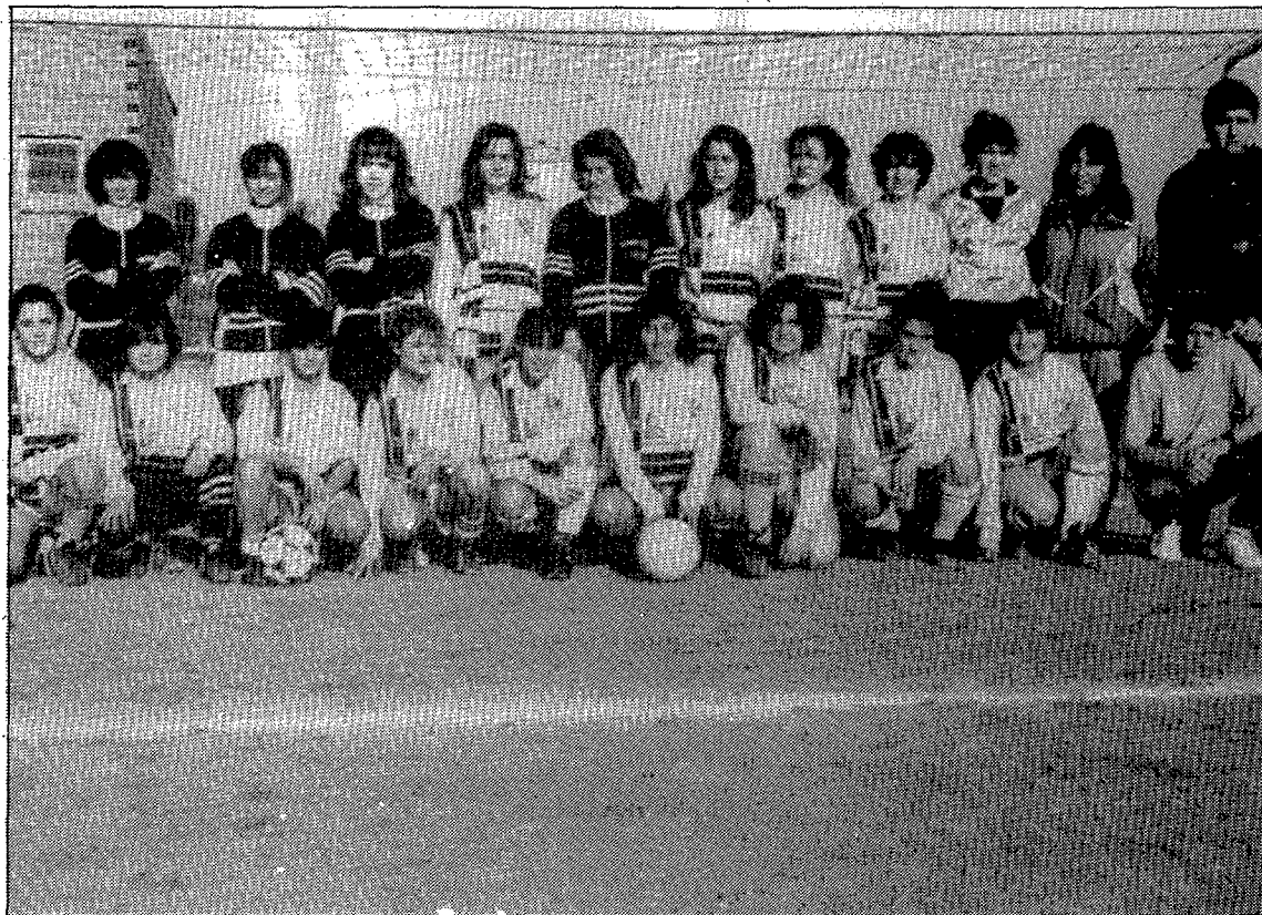
La plantilla del Llers no canviarà gaire. (Foto MARTÍ BATLLE).

La totalitat de la plantilla 1990/91 continuarà una temporada més