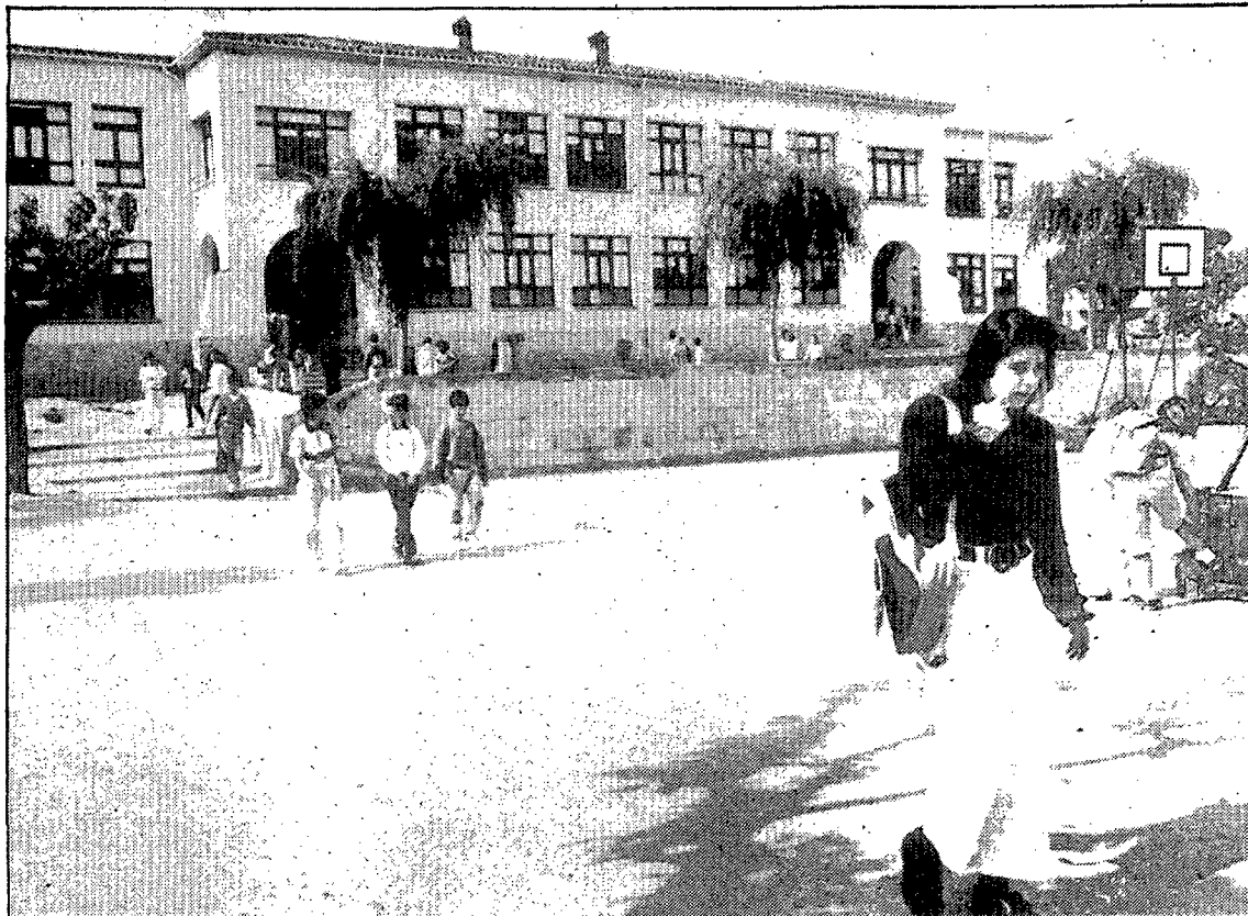
Segons el criteri d'un grup de pares d'alumnes de vuitè d'EGB de l'escola pública de Caldes, el col·legi és el lloc adequat per a donar informació als fills sobre sexualitat.