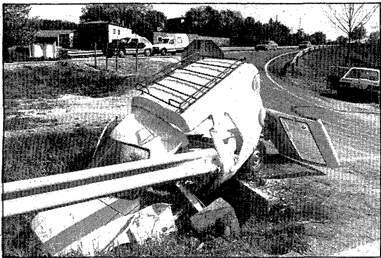
Furgoneta siniestrada en la carretera de Barcelona.