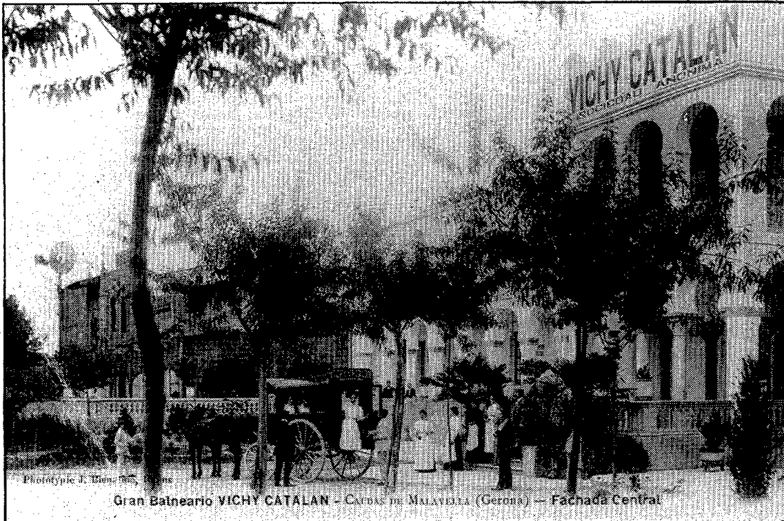
L'exposició inclou fotografies com aquesta, que rememoren en la història moments de la vida dels balnearis.

«Caldes de Malavella, manantial de Catalunya» no és una exposició que obre les seves portes durant un temps determinat i després les tanca. Boades ha afirmat que «és una exposició itinerant arreu de Catalunya. A Caldes romandrà oberta fins al 15 de novembre, després anirà a les capitals, Barcelona, Lleida i Tarragona, i a diverses poblacions que ho han