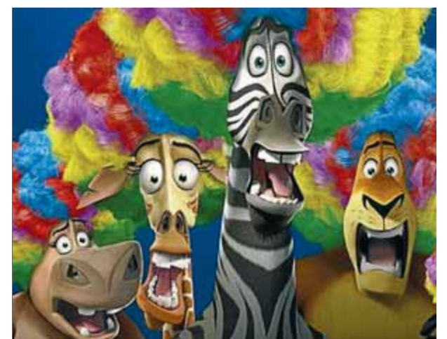
Fotograma de 'Madagascar 3'

La proposta ha estat organitzada per l'Ajuntament de Figueres, l'Oficina de Català de Figueres, el Consorci per a la Normalització Lingüística i el Cineclub Diòptria, amb el suport de la direcció general de Política Lingüística de la Generalitat. ■