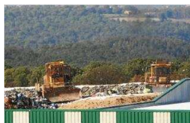
El projecte de millora de l'abocador de Solius està pendent d'assignació pressupostària.