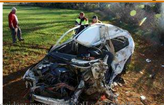
Accident mortal a la N-II a Vilabertran