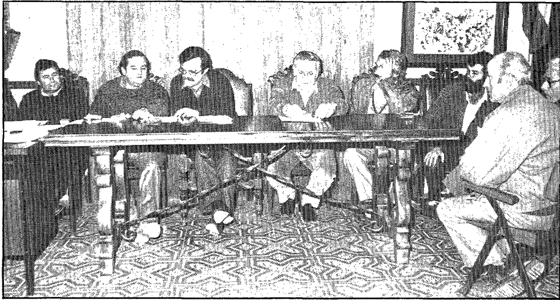
L'equip de govern de Sant Joan es mostrà dispoat a dimitir si no entrava ràpidament en vigència el pla general. (Foto JULI).

Sant Joan les Fonts aixecà polèmica des dels inicis de la seva aprovació. Un cop va ser presentat a la Comissió provincial d'urbanisme, s'informà que havia estat suspès; temps més tard, s'anuncià que s'aprovaria amb la introducció de certs matisos. Van ser aquestes modificacions les que comportaren el malestar del consistori. Algunes d'elles foren acceptades per l'Ajuntament, però les referents a la supressió de la zona urbanizable de Sant Cosme no foren acceptades.