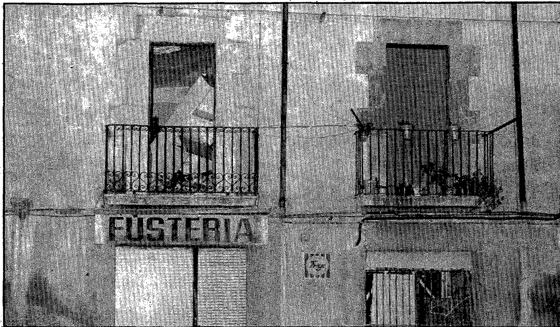
El suelo de una habitación cayó sobre el primer piso. (Foto DANI DUCH).

Los hechos ocurrieron en una de las viviendas sitas en el segundo piso. En la actualidad se hallaba deshabitado, pero estaba siendo arreglado por una pareja que piensa contraer en breve matrimonio y que tiene intención de instalarse en el mismo. Al parecer en el momento en que ocurrieron los hechos, minutos después de las siete de la tarde de ayer, la joven estaba ultimando detalles en el piso cuando por causas desconocidas ocurrieron los hechos. El suelo del segundo piso se hundió cayendo al primero y con el firme