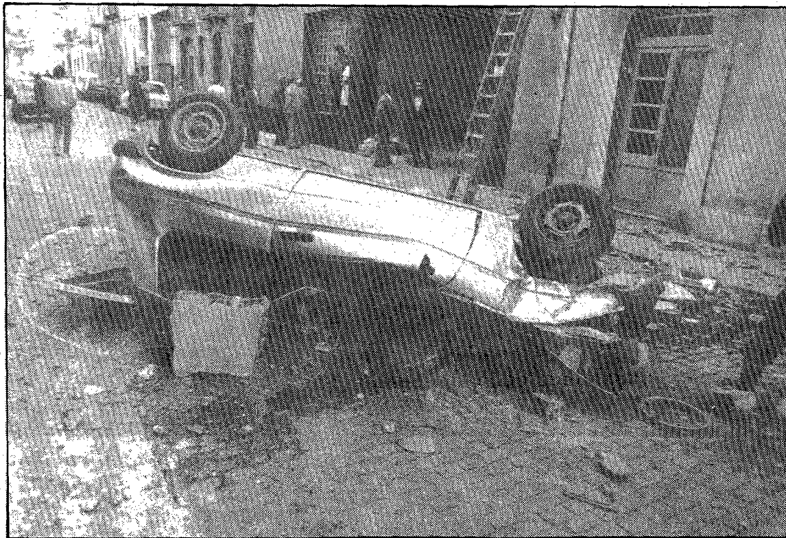
El Talbot Samba quedó absolutamente destrozado. (Foto DANI DUCH).

Lo cierto es que la calle Figuerola quedó convertida en un caos. Policía Nacional, Policía Municipal, Bomberos de la Generalitat y trabajadores de Hidroeléctrica de Catalunya y Enher, cuyas líneas habían resultado afectadas, llegaron a los pocos minutos y comenzaron los trabajos de desescombro, ya que el trozo de pared que había cedido cayó sobre la calle. A causa de la caída del vehículo,