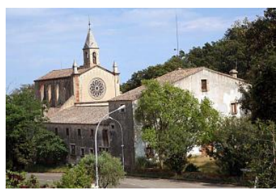
L'espai que ocupa l'ermita i l'hostatgeria de Sant Grau, a la carretera que uneix Tossa amb Llagostera. carles colomer

Quaranta-cinc anys després que l'entitat financera Ibercaja s'apropiés de l'ermita de Sant Grau per una hipoteca impagada, Tossa en tornarà a ser la titular un cop el Departament d'Economia i Finances de la Generalitat permeti al consistori desemborsar 990.000 euros per a la seva adquisició que haurà de pagar durant quinze anys, sense interessos. En el ple municipal que se celebrarà aquest matí, el govern de CiU, amb majoria absoluta, aprovarà el nou plec de clàusules per a l'adquisició de la finca. Aquestes preveuen mantenir el mateix preu de l'any 2003, quan CiU i AET van decidir comprar l'espai, però permet augmentar en cinc anys el seu pagament.