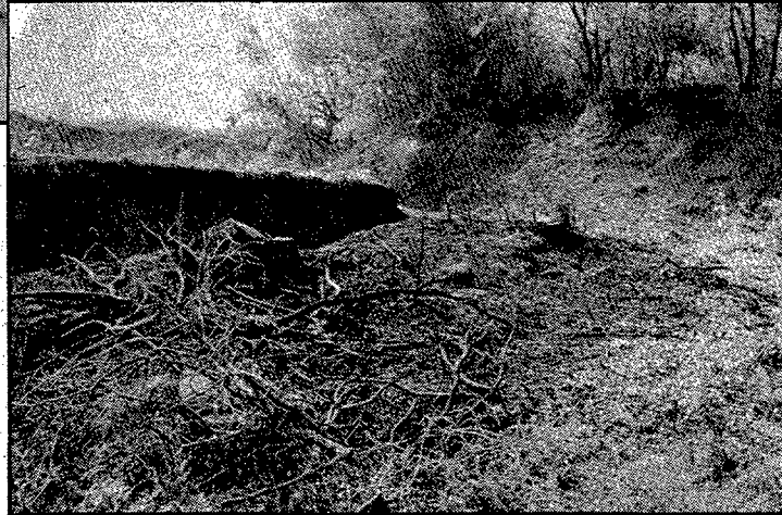
El incendio de Palol de Revardit puede dar mucho que hablar.

Se da la circunstancia de que Palol de Revardit es una zona declarada, dentro de la comarca del Gironès, zona de alto riesgo de incendio.