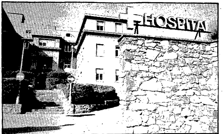
Les urgències de Sant Feliu hauran de passar per l'hospital de Palamós.

Arribar amb ambulància a la residència de la Seguretat Social és cosa de no gaire més de mitja hora, el temps necessari per cobrir els trenta-quatre quilòmetres que separen Sant Feliu de Girona, men-