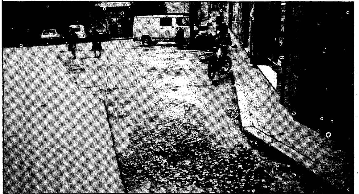
Abans de finals d'any començaran a Caldes les obres per fer desaparèixer la imatge dels carrers a mig asfaltar.