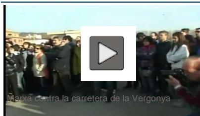
Marxa contra la carretera de la Vergonya