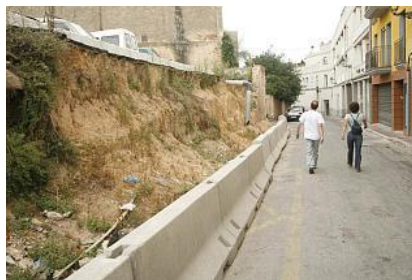
El PTOp subvenciona amb 16,3 milions la reforma del nucli antic de 5 municipis

GIRONA | JOFRE SÁEZ El Departament de Política Territorial i Obres Públiques (PTOP) va adjudicar ahir la sisena convocatòria de la Llei de Barris que beneficiarà cinc municipis de les comarques de Girona amb un import total de 16,3 milions d'euros. Els municipis beneficiaris de l'ajut que els permetrà reformar el nucli antic són Anglès, Arbúcies, Llagostera, Sant Feliu de Guíxols i la Bisbal de l'Empordà.