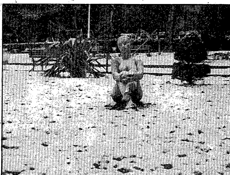
En Figueras cayó poca nieve pero bastó para que cuajara en los parques.