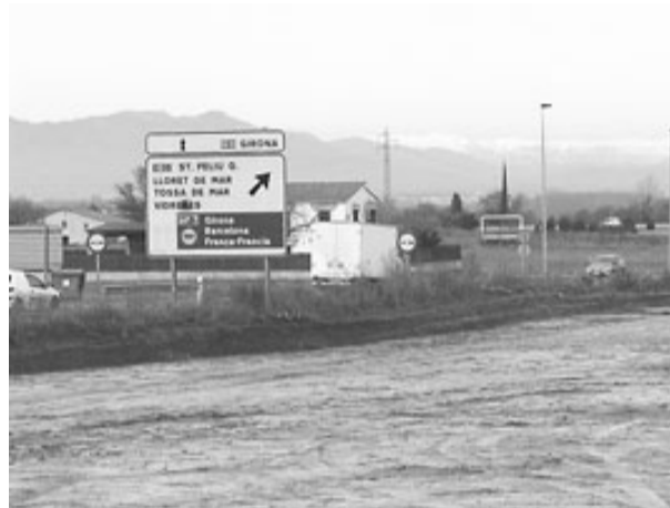
Les obres a Maçanet estan aturades.

Respecte d'aquest traçat de l'A-2 encara hi ha un recurs de l'Ajuntament de Blanes a l'Audiència