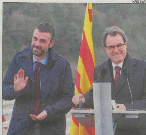
Santi Vila i Artur Mas durant l'acte inaugural.

Tampoc es va comentar res sobre una altra de les incògnites que planen sobre l'obertura d'aquesta autovia, com és l'entrada en servei de l'enllaç de l'Eix Transversal amb la N-II a Caldes de Malavella. De moment, les úniques connexions que es permeten són la de sortida de l'Eix en direcció a Barcelona i la d'incorporació venint de la capital per la N-II. Les connexions amb Girona, doncs, segueixen a l'aire.