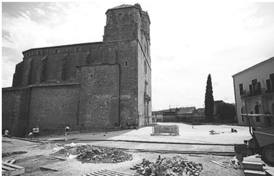
A dalt, la plaça de la Llibertat, amb els fanals instal·lats. A sota, la plaça del Castell.

centre de la plaça del Castell, i es col·loca d'un sol color, sense fer la distin-