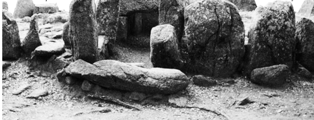
La cova d'en Daina, a Romanyà de la Selva. Construcció megalítica que està qualificada de monument nacional.

Balaguer també assenyala que aprofitant aquest treball de camp també faran prospeccions arqueològiques de superfície a la zona per veure si troben eines o ossos. «Farem un treball molt complet, i ens faria gràcia que el Consorci de les Gavarres ens ajudés, ja que així l'estudi podria ser molt més potent», assenyala. Balaguer calcula que fer tota aquesta feina requerirà treballar durant un any.