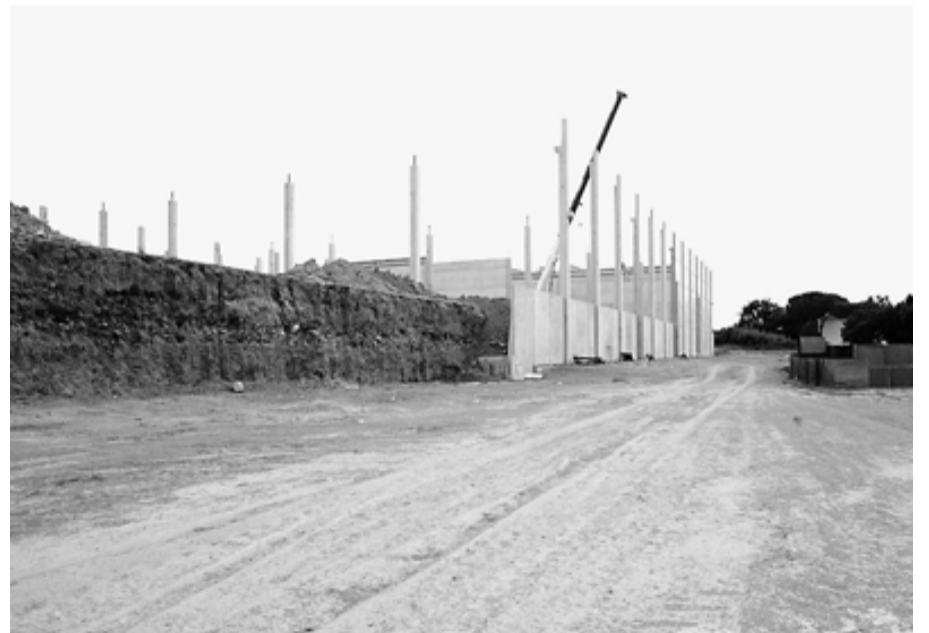
El polígon del Pla de l'Illa de Quart, en procés de desenvolupament.

El polígon del Pla de l'Illa es va desencallar a principi d'any, des-