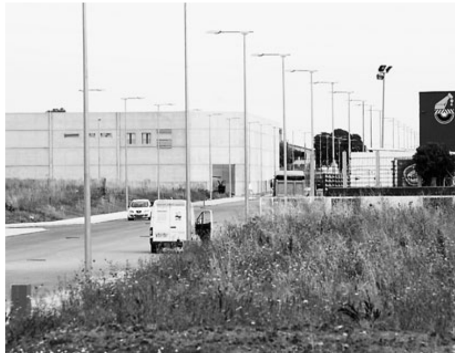
Imatge del polígon industrial del Pla de la Seva de Fornells.

Llagostera disposa de 38,9 hectàrees als sectors Sud-10, Sud-11 i Sud-12. El Sud-11 està aturat i