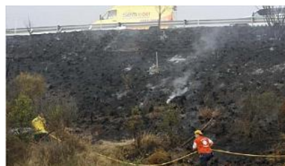
Un llamp crema 3.000 m2 de matolls a la costa d'Alou i provoca cues a l'autovia

GIRONA | E.PADILLA/R.REYNER La pluja va caure ahir a les comarques gironines acompanyada en alguns casos de tempesta, com a Girona ciutat i en diversos punts del Gironès. És el cas de Llagostera. A l'alçada d'aquest municipi, un llamp va provocar poc després d'un quart de quatre de la tarda un petit incendi en un tros de terreny entre els carrils d'una i altra direcció de la costa d'Alou. Els bombers el van tenir controlat en poc més de vint minuts, però el resultat va ser doble: 3.000 m2 de matolls cremats i cues a l'autovia de la C-65. Malgrat les precipitacions, ahir es van assolir els trenta graus de temperatura màxima a diversos punts del territori gironí, de manera que la calor es va seguir notant, sobretot al matí i abans que la pluja es fes present.