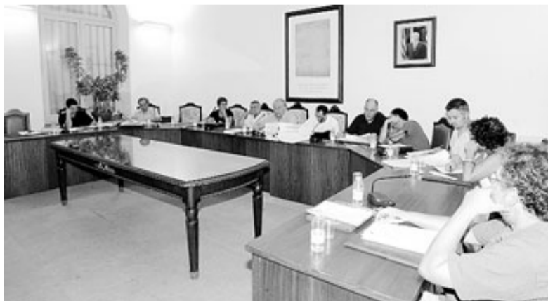
El ple en què es va aprovar definitivament el conveni de Can Boada.

MONTSE BARRERA / Llagostera ● El ple de l'Ajuntament de Llagostera de dimecres va batre el rècord de durada, 5,45 hores. Entre un total de catorze punts, va aprovar definitivament el conveni de Can Boada per al polígon industrial, punt que va posar de relleu un cop més les visions contradictòries entre l'equip de govern i els grups de l'oposició, que hi van votar en contra. De fet, a Llagostera, les opinions en temes urbanístics han divergit històricament. Als anys 70 ja van crear polèmica els intents de construir un circuit per part de Motor Ibérica al sector de Can Gascons, com també les previsions d'un aeròdrom a Panedes a començament dels anys 80. També va ser polèmic el projecte per fer un macrogeriàtric en terrenys de Can Boada, els anys 90, ara polèmics per la construcció del polígon per part l'Incasòl i la societat Agrícola