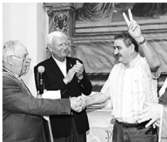
Anoro, a la dreta, en rebre el reconeixement.

—«Sempre hem dit que tenim un país immensament ric gastronòmicament parlant. Hi ha llocs que això no ho tenen. Als estats italià i francès han treballat la cuina tradicional. Aquí l'hem deixat de