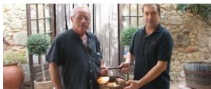
Un dels boletaires que es van acostar ahir al Mas Roure va dur-hi pinatells, siurenys i també algun ou de reig. DDG

Amb menús que oscil·len entre els 25 i els 50 euros per persona, els restauradors llagosterencs asseguren, amb tot, que els estan arribant bolets de molt bona qualitat. Les jornades que ells protagonitzen s'emmarquen dins la setena Festa del Bolet ( www.festabolet.com ), que dilluns se celebrarà al municipi.