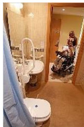
«No he trobat cap lloc tan adaptat»

LLAGOSTERA | JORDI VERA GARCIA Anar a la platja, fer vela, visitar Barcelona, Girona, els pobles de l'Empordà o els volcans de la Garrotxa. Aquestes són algunes de les activitats que organitza l'empresa Let's Go Costa Brava, una agència de viatges especialitzada en persones amb mobilitat reduïda. L'empresa, que pertany a la Fundació Lacustaria del Grup Fundació 60 (propietat de la família Mallart), disposa de diversos apartaments totalment adaptats a Llagostera, on allotja els seus clients. La filosofia, doncs, és oferir allotjament accessible -en els seus apartaments- i, a partir d'aquí, l'empresa gestiona tots els recursos turístics, de transport i serveis que els clients necessiten. I ho fa a cost zero.