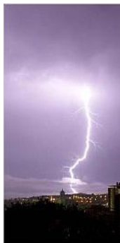
Un dels llamps la nit del dijous. joan montaner

En aquestes poblacions on va haver-hi inundacions també van existir problemes amb l'electricitat. El temporal va ser la causa de "petits talls del subministrament elèctric", segons fonts de Fecsa Endesa. "Aquests problemes se solucionen en pocs segons i són normals quan hi ha condicions climatològiques adverses", va explicar l'empresa subministradora d'energia.