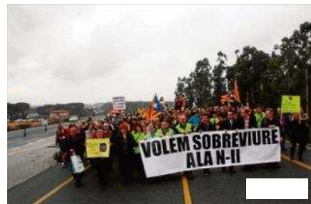
Els manifestants en el moment, en el qual van tallar la N-II a l'alçada del Tourist Club a Caldes de Malavella. ACN

CALDES DE MALAVELLA | ACN/DDG. Uns 200 veïns de Vidreres, Sils, Caldes de Malavella i Maçanet, organitzats per la plataforma N-II, ahir, es van manifestar i van tallar la circulació de la carretera al seu pas per la urbanització Tourist Club, al llinar entre els municipis de Caldes de Malavella i Sils. Els manifestants van demanar el desdoblament d'aquesta via al seu pas per les comarques gironines al Govern Estatal i van denunciar l'alta taxa de mortalitat i perillositat que suposa aquesta carretera. Segons les dades aportades per l'entitat, en el que portem d'any s'han registrat 100 accidents, amb 12 morts. Des que es van aturar les obres l'any 2009, només en el tram de Maçanet a Caldes 14 persones han perdut la vida .