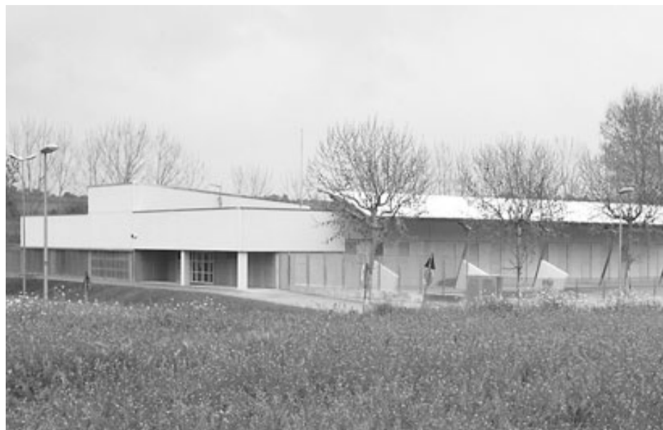
Panoràmica del nou CEIP La Pedra Blanca, de la Pera.

A les comarques de Girona hi haurà, a l'inici del nou curs, 426 centres públics d'ensenyament, 14 més que fa un any. La diferència respon sobretot a l'increment del nombre de llars d'infants, que són 116, 10 més que el curs passat. De privats n'hi haurà 95, un menys que l'any passat, pel canvi de titularitat al Puig de les