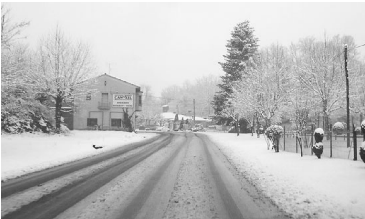
Una imatge de la nevada d'ahir al municipi de Santa Pau.