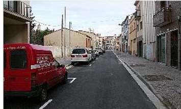
El carrer Tomas Boada, amb les obres gairebé acabades.