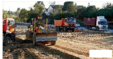
Les màquines treballen per desbrossar i anivellar el tram entre Sils i Caldes de Malavella. aniol resclosa

GIRONA | ACN/DDG Les màquines van tornar a 11 dies de l'inici de la campanya electoral a trepitjar el terreny de les obres empannegades de la N-II entre Caldes i Sils, després que se signés fa pocs dies l'adjudicació de les obres que han de durar 15 mesos. Durant aquests primers dies, els treballs se centraran a desbrossar i anivellar els terrenys, que es troben en un important estat de deixadesa després d'estar tres anys i mig sense màquines, així com la millora dels accessos. La previsió és que a partir de la setmana que ve es comencin a fer intervencions a la calçada actual de la N-II relacionades amb la millora del ferm i la senyalització per tal de garantir al màxim la seguretat dels vehicles. L'empresa adjudicatària és Acciona i el pressupost, 32,4 milions d'euros.