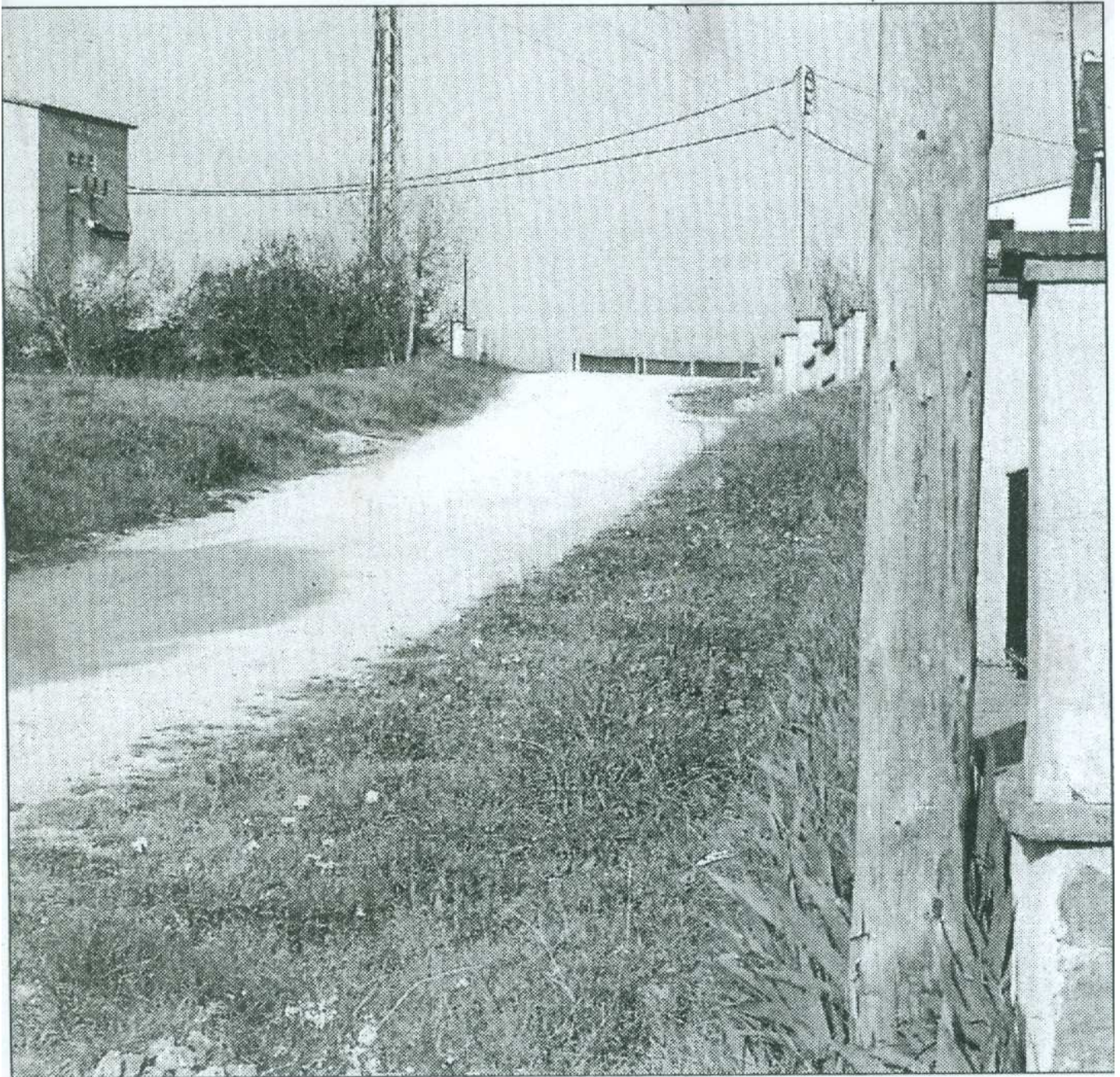
Els carrers sense asfaltar de la zona del carrer Balmes.