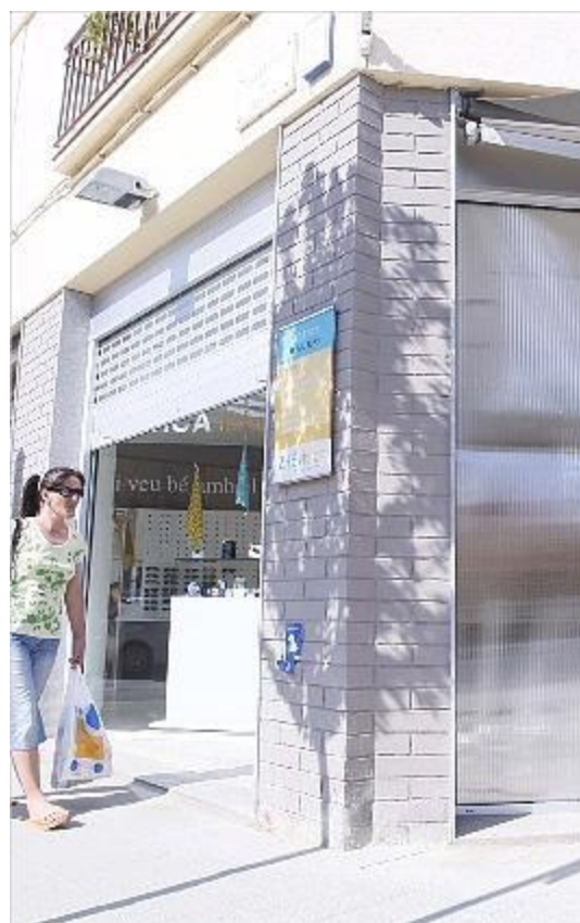
Aquesta òptica de Cassà és un dels llocs on hauria actuat la banda.