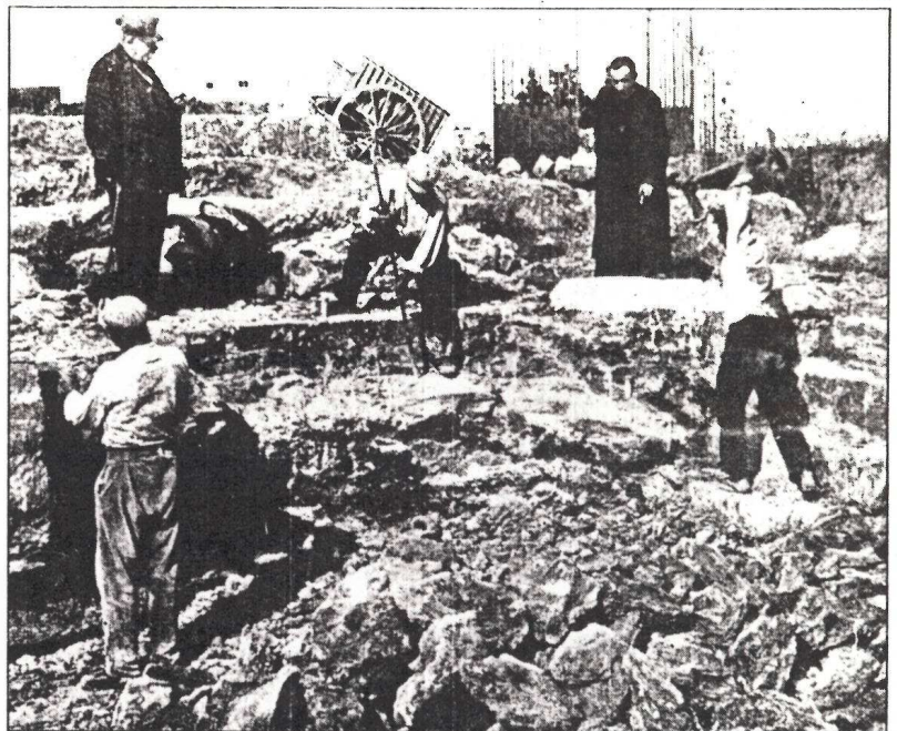
Les excavacions a les termes romanes de Caldes de Malavella, a principi d'aquest segle. A baix, vista exterior del castell de Montsoriu.

Si a Caldes de Malavella l'antiguitat de les termes ens trans-