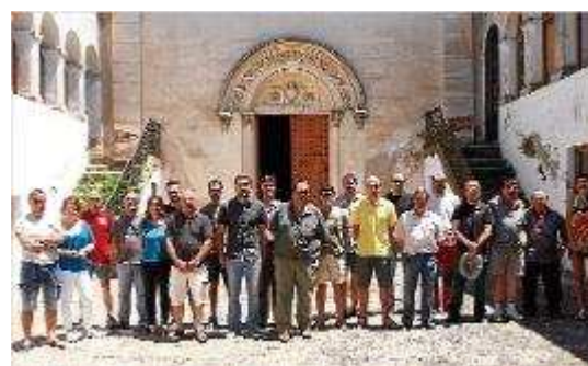
Els tècnics, regidors i membres del Consorci al pati de Sant Grau. carles colome

L'objectiu de la ruta és dinamitzar el massís, segons Adrobau així com també canviar l'oferta del model turístic de la zona i potenciar "l'entorn de cultura, història i natura" i per això, transcorrerà i donarà a conèixer els espais tant dels pobles de primera línia de costa com els de segona. I segons Nadal, el Consorci també té com a objectiu "gestionar el Massís i treure'n profit econòmic per dinamitzar els municipis sobretot en l'actual època de crisi i incertesa". La ruta es presentarà a partir del setembre i de cara a la tardor, es podrà transcórrer l'Ardenya-Cadiretes des d'un altre punt de vista.