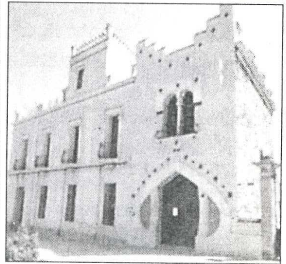
D'esquerra a dreta: casa Quintana, façana del balneari Prats, termes romanes i casa Rosa.

lavella estudia reestructurar el Casinet, un local d'uns 50 metres que hi ha al costat de la font